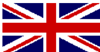
Vlajka Velké Británie

Velká Británie je království, které se nachází na několika ostrovech v severozápadní Evropě. Je to jeden z evropských států s největším počtem obyvatel a dlouho to také byl jeden z nejmocnějších států. Británie také patří mezi země, které aspoň trochu zná snad každý, a už se mu vybaví londýnské dvoupatrové autobusy, typičtí strážníci, ať o páté, anglická královna nebo třeba známé fotbalové kluby a jejich fanoušci. Ten, kdo se učí anglicky, taký dříve nebo později narazí na rozdíly mezi angličtinou, kterou se mluví ve Velké Británii,