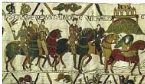
Tapisérie z Bayeux, zobrazující bitvu u Hastingsu r. 1066

rozvíjela, zvířila v několika válkách a stala se jedním z nejbohatších států v Evropě. V šestnáctém století začali Angličané osazovat rozsáhlé oblasti v Severní Americe (které do té doby patřily místním indiánským kmenům). Do nových území se stěhovalo mnoho obyvatel z celé Evropy, ale