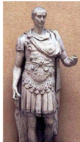
Gaius Iulius Caesar

stolu. Nájezdníci se postupně v Británii usadili a vytvořili vlastní království; z germánského kmene Anglů se stali předkové dnešních Angličanů. Británie ale byla ještě mnohokrát napadána, například Vikingy z Dánska a Norska. Významným rokem je pro Angliany 1066, kdy byla anglická armáda poražena Vilémem Dobytčím, který se pak stal novým králem Anglie. Během středověku se Anglie úspěšně rozvíjela, zvířila v několika válkách a stala se jedním z nejbohatších států v Evropě. V šestnáctém století začali Angličané osazovat rozsáhlé oblasti v Severní Americe (které do té doby patřily místním indiánským kmenům). Do nových území se stěhovalo mnoho obyvatel z celé Evropy, ale