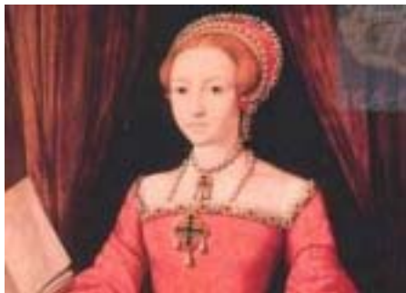
Královna Alžběta I. (*1533, M1603)

v osmnáctém století se začaly bouřit proti Británii kvůli vysokým daním, které museli platit. Tak mezi Británií a obyvateli Ameriky vypukla válka, ve které Američané vyhráli a roku 1783 vytvořili Spojené státy americké. Británie ale stále zůstala mocným státem, který ovládal mnoho území po celém světě.