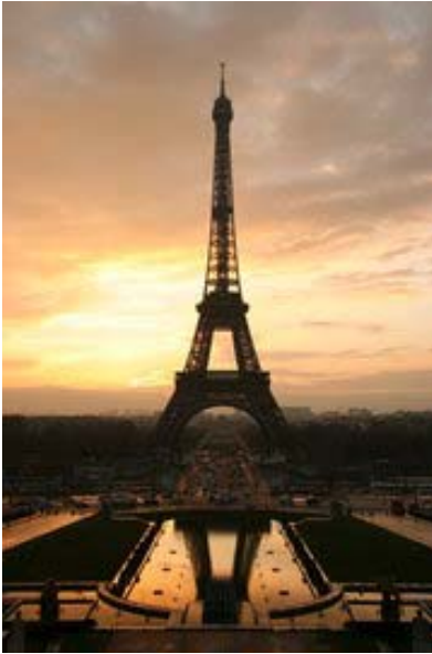
Eiffelova věž, postavená v letech 1887 – 1889

Francie je rájem pro labužníky a milovníky vína – většina známých odrůd je pojmenována po některé francouzské oblasti, včetně toho nejznámějšího – perlivého šampaňského. V hlavním městě Paříži není jen světově proslulá Eiffelovka , ale také katedrála Notre Dame, proslavená hrbatým zvoníkem Quasimodem, královský palác Louvre, dnes proměněný v obrovskou obrazárnu a muzeum, nebo chlouba moderní architektury – čtvrť La Defense. Zatímco Paříž byla a stále je městem studentů a básníků, malíři nejraději pobývají na jihu v Provence, proslulé zvláštním světlem a celými poli levandule, která je jednou ze základních surovin pro výrobu parfémů. Jména nejslavnějších – Chanel a Dior – označují nejen vůně, ale i dámskou módu nejvyšší světové kvality.