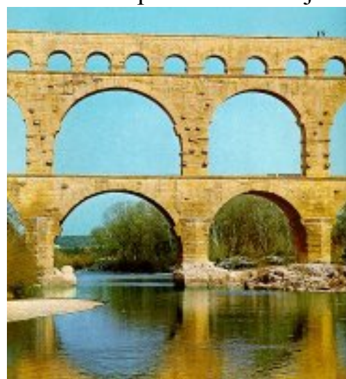
Pont du Gard

Francie je oblíbeným cílem turistů z celého světa: v létě se jezdí k moři na Riviéru, v zimě lyžovat do Alp a po celý rok za historickými památkami, kterých je ve Francii opravdu hodně. Stačí zmínit velké katedrály v Chartres , Rouenu nebo Remeši, starobylý římský akvadukt (most používaný pro přívod vody do městského vodovodu) Pont du Gard, nebo zámky u řeky Loiry.