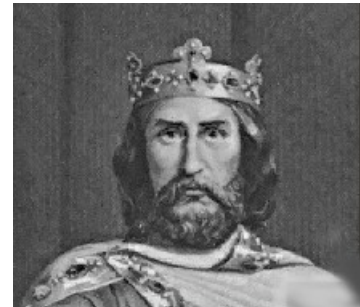
Karel Veliký, franský král v letech 771 – 814

Dnešní Francie byla dlouho součástí Římské říše. Nazývala se tehdy Galie a k Římu ji připojil Julius Caesar . Za předchůdce dnešní Francie můžeme považovat Franskou říši, která vznikla v raném středověku a zahrnovala i většinu dnešního Německa, Rakousko, severní Itálii a další státy. Nejznámějším vládcem byl Karel Veliký , který se roku 800 dokonce nechal korunovat na císaře. Ve středověku Francie dlouho válčila s Angličany, kteří obsadili velkou část země. Toto období se nazývá stoletá válka a