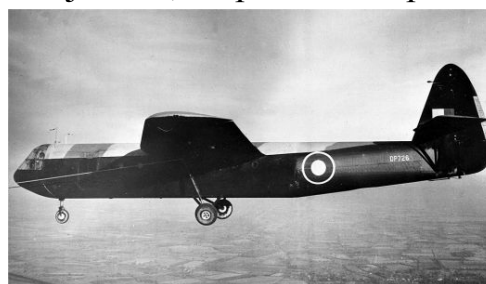
Britský kluzák Airspeed AS.51 Horsa

Poté se vůdci mocností dva roky scházeli a ujednali, že provedou operaci Overlord, jejíž organizaci svěřili výkonnému výboru COSSAC. V roce 1943 ještě provedli krycí operaci Bodyguard, která měla za úkol přesvědčit Němce, že hlavním cílem vylodění bude Calais a jižní Norsko. Spojenci vyslali 3 letecké divize: 6. britskou, 82. a 101. americkou. Jejich úloha byla obsadit strategická místa a přerušit komunikaci mezi velením ve vnitrozemí a oddíly na pláži. K přepravě výsadců bylo určeno 460