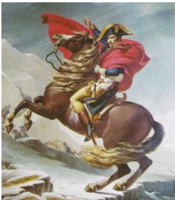
Napoleon I. Bonaparte, císař Francouzů v letech 1804 - 1814

jednotlivými skupinami revolučníků se chopil vlády generál Napoleon, který se stal novým francouzským císařem. Byl to jeden z největších vojevůdců v historii – dobyl téměř celou Evropu, ale nakonec byl poražen, když se proti němu spojili všichni ostatní evropští vládcí. Ve Francii se pak ještě jednou vystříдалo království, republika a císařství, až byla na konci 19. století definitivně zavedena republika. Francie se pak zúčastnila obou světových válek proti Německu a po druhé