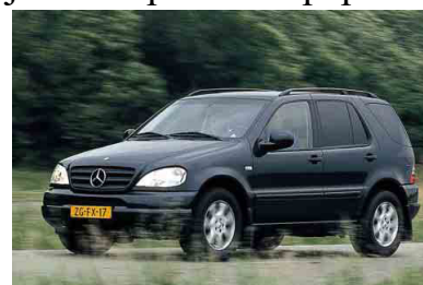
Mercedes-Benz M 430 před přestavbou na papamobil

Stejně jako všechny předchozí papamobily má i tento dvě oddělené kabiny. Jednu celkem běžnou pro řidiče a spolujezdce,