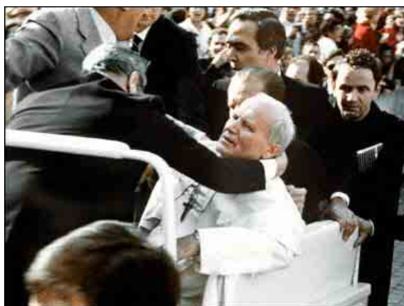
Jan Pavel II. těsně po atentátu v květnu 1981

16. října 1978 je Karol Wojtyła zvolen papežem – z Karola Wojtyly se stává papež Jan Pavel II., první papež slovanského původu (a první neitalský papež od roku 1522).