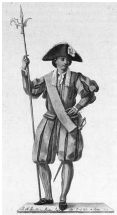
Švýcarská garda v 16. století...

Funkci policie, armády i ochranky plní ve Vatikánu takzvaná Švýcarská garda. Jedná se o nejmenší armádu na světě – má přesně pouhých 100 členů – 4 důstojníky, 23 poddůstojníků, 70 řadových vojáků, kterým se říká halapartníci, 2 bubeníky a jednoho kaplana (tj. kněze). Jak už název napovídá, jejím členem se může stát pouze Švýcar, navíc musí být vyšší než 173 centimetrů, musí být katolík, svobodný, nesmí mít knírek, nesmí být homosexuál a musí absolvovat alespoň učňák. Velitel gardy by měl ještě mít šlechtický titul.