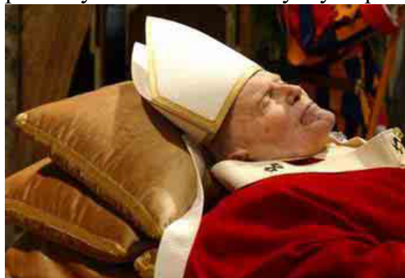
Tělo Jana Pavla II. v chrámu sv. Petra ve Vatikánu

podstaty a revolučnosti by bylo příliš zdlouhavé a složité. Papež také sehrál výraznou roli při pádu komunistického bloku.