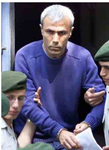
Mehmet Ali Agca

13. května 1981 byl na papeže spáchán atentát. Turek Mehmet Ali Agca na Jana Pavla II. několikrát vystřelil z pistole. Jan Pavel II. byl těžce raněn, ale život mu zachránil jeden odvážný gardista