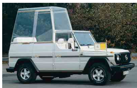
Papamobil z roku 1980 (Mercedes-Benz 230 G)

Možná jste už viděli v televizi nebo víte, že papež Jan Pavel II. se mezi shromážděnými věřícími projížděl ve zvláštním automobilu – tzv. „papamobilu“ („papa“ je italsky papež). Dodávání těchto aut je odjakživa výsadou firmy Mercedes-Benz. První papamobil dostal již papež Pius XI. v roce 1930 – dnes ho můžete vidět ve vatikánském muzeu, stejně jako všechny pozdější. (Teprve Jan Pavel II. však začal papamobil používat pro setkání s věřícími; dříve byli papeži