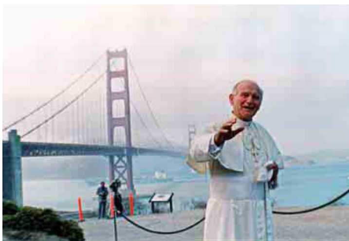
Jan Pavel II. před slavným mostem Golden Gate Bridge v San Francisku

Jan Pavel II. svatořečil více lidí než kterýkoli jiný papež v historii. Byl také nejzcestovalejším papežem dějin – jako první papež v dějinách navštívil více než 100 zemí světa. Poprvé od roku 1523 byl papežem, který nebyl původem Ital (před ním byl posledním „Neitalem“ Holanďan Hadrián VI., vlastním jménem Adrian Dedel). Zároveň byl prvním Polákem a vůbec prvním Slovanem na papežském stolci. Jeho pontifikát patří k nejdelším v historii – více než jeho necelých 27 let strávili v úřadu jen Pius IX., který byl papežem mezi roky 1846-1878, tedy 32 let, a vzdoropapež Benedikt XIII., který svůj vzpurný úřad zastával v letech 1394-1429.