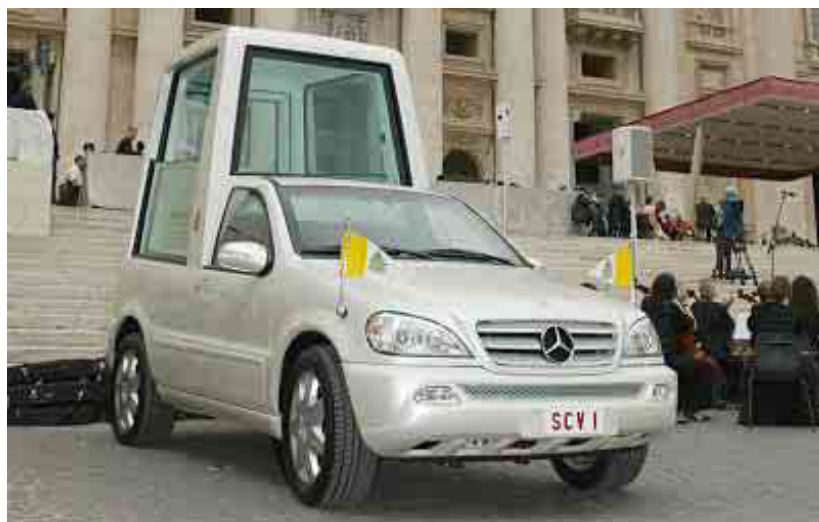
Nejnovější papamobil – Mercedes-Benz M 430

druhou, vyvýšenou, aby v ní mohl i stát, pro papeže a případný doprovod. I v případě poruchy na elektrické instalaci vozu je v zájmu bezpečnosti papeže nutné zajistit jeho odjezd, proto má spínací skříňka mercedesu i rezervní tlačítko, jímž se dá motor nastartovat zvláštním okruhem.