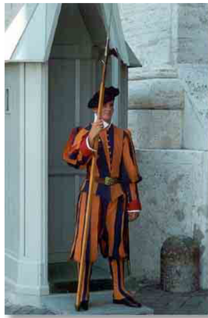
... a dnes

Funkci policie, armády i ochranky plní ve Vatikánu takzvaná Švýcarská garda. Jedná se o nejmenší armádu na světě – má přesně pouhých 100 členů – 4 důstojníky, 23 poddůstojníků, 70 řadových vojáků, kterým se říká halapartníci, 2 bubeníky a jednoho kaplana (tj. kněze). Jak už název napovídá, jejím členem se může stát pouze Švýcar, navíc musí být vyšší než 173 centimetrů, musí být katolík, svobodný, nesmí mít knírek, nesmí být homosexuál a musí absolvovat alespoň učňák. Velitel gardy by měl ještě mít šlechtický titul.