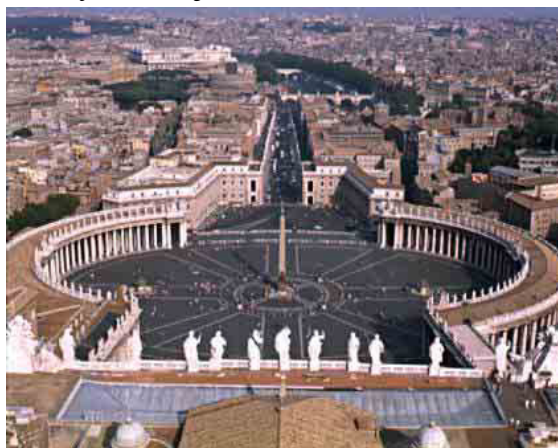
Náměstí svatého Petra ve Vatikánu

Státní zřízení je nezávislá teokratická absolutní monarchie, což sice zní dost nesrozumitelně, ale znamená to jen známou skutečnost, že hlavou státu je papež, který má právo rozhodovat o všem, co se děje. Úřední jazyky jsou latina a italština, nic takového jako vatikánština samozřejmě neexistuje. Zdejší peníze se správně jmenují vatikánská lira (1000 lir za 18 našich