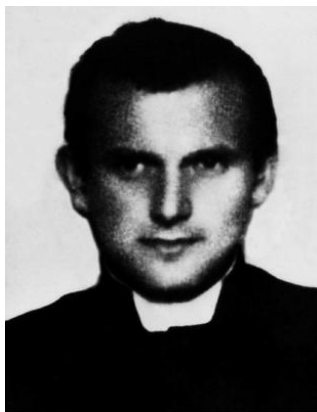
Mladý kněz Karol Josef Wojtyła

povinnosti. Budoucí papež nastoupil do kamenolomu, kde vystřídal několik zaměstnání, až nakonec v roce 1941 zakotvil v čistírně sody.